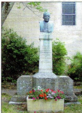
Les fondations de la stèle sont fracturées par les racines d'arbres trop proches. La stèle s'incline progressivement.

La signature d'une convention entre la Fondation du Patrimoine, la Commune de Saint-Jean et Saint-Paul et l'association « les journées Coste » pour restaurer la stèle Coste et son environnement à Saint Paul des Fonts, est paru dans Le Progrès du 29 décembre 2016. Pourquoi ce projet ?