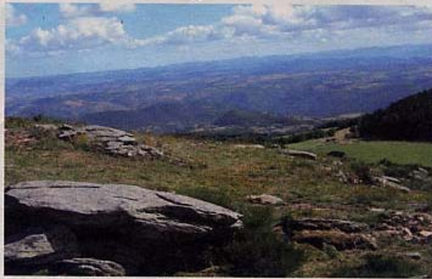
Vue du signal de Ronsignac.

Séquence toujours très appréciée pour la qualité des sujets